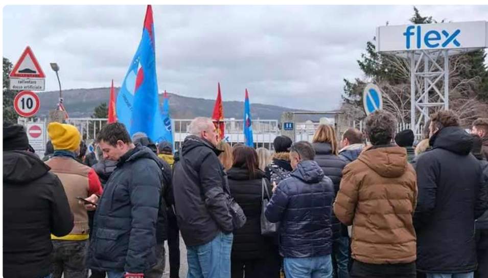
La protesta davanti alla Flex dello scorso 27 gennaio

È tutto pronto per la mobilitazione di sabato 8 febbraio , in difesa dei lavoratori della Flex e del futuro industriale del territorio. Da oggi fino a venerdì i sindacati faranno volantinaggio per invitare i triestini a unirsi alla manifestazione. L'obiettivo è coinvolgere la cittadinanza in vista del tavolo convocato al Mimit il 12 febbraio. Il concentramento è previsto per le 9.30 in piazza Oberdan. Da lì, intorno alle 10, partirà il corteo che sfilerà lungo via Carducci fino a piazza Goldoni , per poi proseguire su corso Italia e concludersi in piazza della Borsa, dove si terranno i comizi di tre delegati dei lavoratori di Flex, U-blox e Tirso e dei rappresentanti di Fim Cisl, Fiom Cgil e Uil.